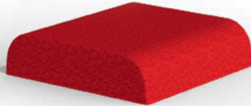
Artikel - Nr. 35 2316 xx1